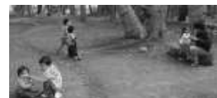
(西公園プレーパークのようす)

★6月に西公園プレジャーパークの会と公園イベントを開催します。お楽しみください！