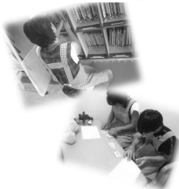
ペンギンが行く! ♪ A. noriko

まだ、夏休み中のひろばの経験がないママは「こんなに賑わってるんですか!？」と、ちょっとビックリしていましたが(笑)そんな中、夏休み中の高校生がボランティアとしてお手伝いに来てくれました。少しお子さんと触れ合いながらも、おもちゃの片づけやカード作りなど、一生懸命お手伝いしてくれましたよ！夏休みが終わると、ちょっと寂しくなるくらい穏やかなひろばに戻ります。これからも、のびすくに遊びに来て下さいね。